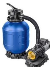
Sandfilter Ø 330mm/5m 3 /h