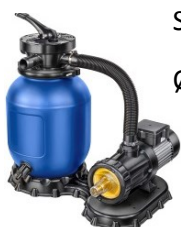
Sandfilter Ø 280mm/4m 3 /h