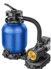
Sandfilter: Ø 280mm/4m 3 /h