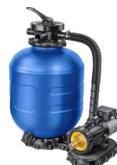
Sandfilter: Ø 400mm/7m 3 /h